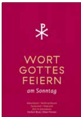
Heribert Blum / Oliver Preisner Wort-Gottes-Feiern Vorbereitete Sonntagsgottesdienste, wenn der Priester unerwartet nicht da ist

192 Seiten, durchgehend zweifarbig Hardcover mit zwei Lesebändchen, 16 x 24 cm € 24,- [D] / € 24,70 [A] ISBN 978-3-7966-1805-5