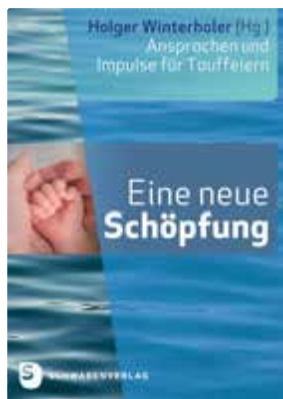
Holger Winterholer (Hg.) Eine neue Schöpfung Ansprachen und Impulse für Tauffeiern

ca. 144 Seiten, Paperback, 14 x 22 cm ca. € 18,- [D] / € 18,50 [A] ISBN 978-3-7966-1823-9