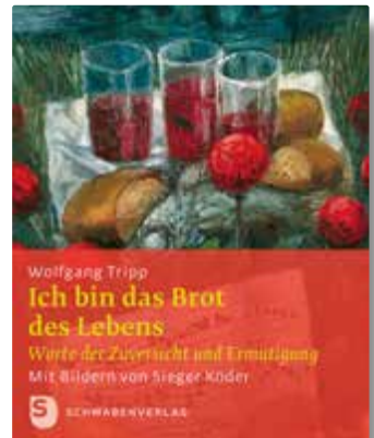
Wolfgang Tripp / Sieger Köder (Maler) Ich bin das Brot des Lebens Worte der Zuversicht und Ermutigung Sieger Köder Geschenkhfte

ab 10 Exemplaren € 3,90 [D] und 7% sparen ab 30 Exemplaren € 3,60 [D] und 14% sparen ab 60 Exemplaren € 3,30 [D] und 21% sparen ab 120 Exemplaren € 3,00 [D] und 29% sparen