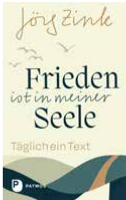
Jörg Zink / Hans-Jürgen Hufeisen (Geleitwort) Frieden ist in meiner Seele Täglich ein Text

ca. 160 Seiten Hardcover mit Leseband, 13 × 21 cm ca. € 18,- [D] / € 18,50 [A] ISBN 978-3-8436-1411-5