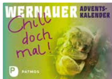
Bischöfliches Jugendamt Wernau (Hg.) Wernauer Adventskalender 2022 »Chill doch mal!«

Leben kann echt anstrengend sein. Schule, Arbeit, Uni, Freunde, Family – alle wollen was und auch wenn's gut läuft, kann einem da manchmal der Kopf schwirren. Zeit für den Wernauer Adventskalender. Mit ihm kannst du abends einfach mal alles gut sein lassen oder morgens ohne Stress den Tag beginnen... für einen ganz entspannten Advent: ohne To-do-Liste, ohne Angst, etwas zu verpassen, ganz gechillt. Denn eins ist klar: Du bist genug, einfach so.