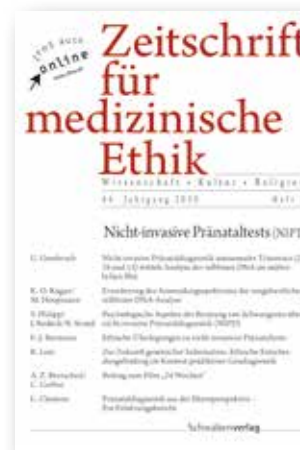
Zeitschrift für medizinische Ethik

Weitere Informationen zu unseren Zeitschriften finden Sie unter www.verlagsgruppe-patmos.de/verlage/zeitschriften Bestellen Sie Ihr kostenloses und unverbindliches Probeheft!