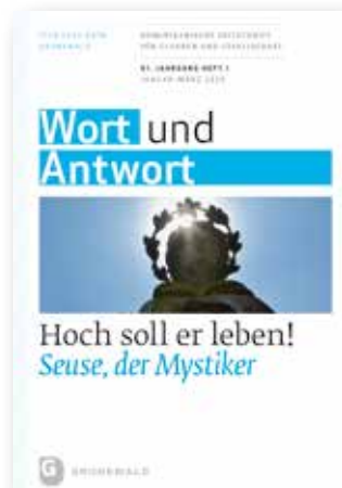
Wort und Antwort Dominikanische Zeitschrift für Glauben und Gesellschaft