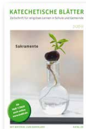
Katechetische Blätter Zeitschrift für religiöses Lernen in Schule und Gemeinde