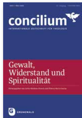
Concilium Internationale Zeitschrift für Theologie