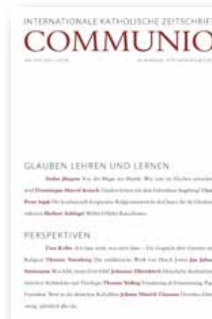
Internationale katholische Zeitschrift »Communio«